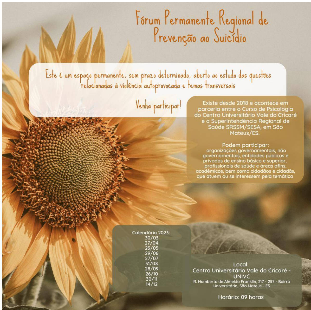
Figura 1- Arte com o cronograma de encontros 2023